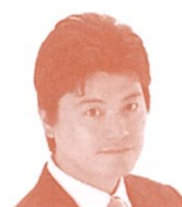
衆議院議員 (自由民主党) 三谷英弘氏