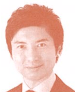
衆議院議員 (立憲民主党) 青柳陽一郎氏