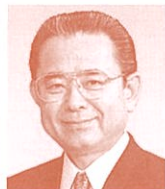
衆議院議員 (自由民主党) 田中和徳氏