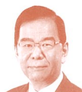
衆議院議員 (日本共産党) 志位和夫氏