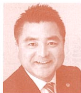
衆議院議員 (立憲民主党) 太 栄志氏