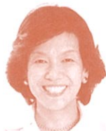
衆議院議員 (立憲民主党) 阿部知子氏