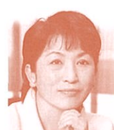
参議院議員 (社会民主党) 福島瑞穂氏