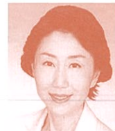
衆議院議員 (立憲民主党) 早稲田夕季氏