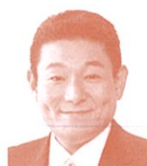
衆議院議員 (立憲民主党) 笠浩史氏