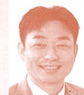
県議会議員 (日本共産党) 井坂新哉氏