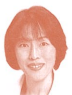
参議院議員 (日本共産党) 田村智子氏