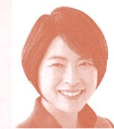
県議会議員 (日本共産党) 大山奈々子氏