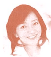
参議院議員 (立憲民主党) 牧山弘恵氏