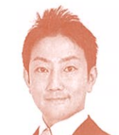
衆議院議員 (立憲民主党) 中谷一馬氏