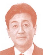
衆議院議員 (自由民主党) 星野剛士氏