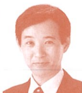
衆議院議員 (立憲民主党) 山崎 誠氏