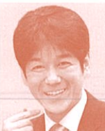
衆議院議員 (自由民主党) 義家弘介氏