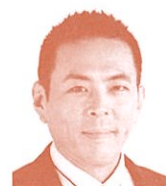
衆議院議員 (立憲民主党) 篠原 豪氏