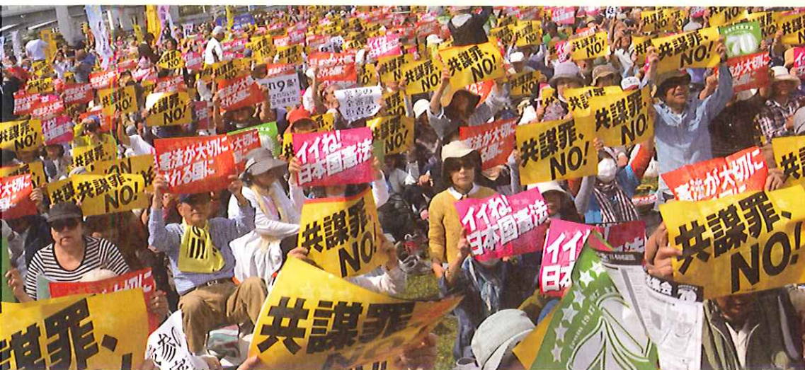
2017年「施行70年、いいネ！日本国憲法5・3集会」5万5000人参加（東京・有明防災公園）

“安倍9条改憲”反対の一点で手をつなぎましょう。3000万人の「戦争はイヤだ」の声を集めて、9条を未来につないでいきましょう。