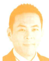
衆議院議員 (立憲民主党) 篠原 豪氏