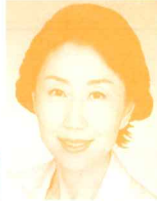
衆議院議員 (立憲民主党) 早稲田夕季氏