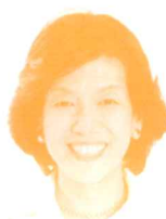
衆議院議員 (立憲民主党) 阿部知子氏