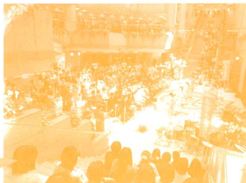
2017神奈川私学スプリングフェスティバル