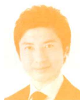
衆議院議員 (立憲民主党) 青柳陽一郎氏