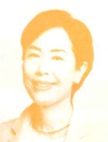
衆議院議員 (日本共産党) 畑野君枝氏