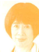
県議会議員 (日本共産党) 君嶋ちか子氏