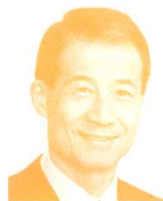
参議院議員 (民進党) 真山勇一氏