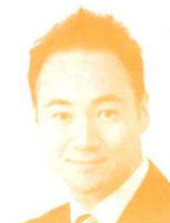
衆議院議員 (自民党) 鈴木馨祐氏