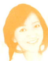
参議院議員 (民進党) 牧山弘恵氏