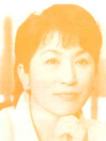
参議院議員 (社民党) 福島瑞穂氏