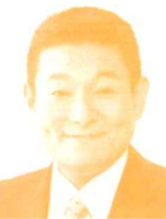
衆議院議員 (希望の党) 笠浩史氏