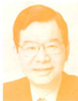
衆議院議員 (日本共産党) 志位和夫氏