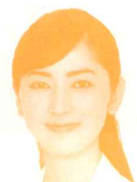
参議院議員 (公明党) 佐々木さやか氏