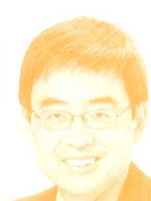
県議会議員 (日本共産党) 藤井克彦氏