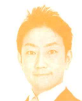
衆議院議員 (立憲民主党) 中谷一馬氏