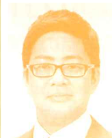
県議会議員 (日本共産党) 木佐木忠晶氏