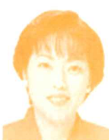
参議院議員 (日本共産党) 田村智子氏