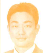
県議会議員 (日本共産党) 井坂新哉氏