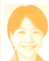
県議会議員 (神奈川ネットワーク運動) 佐々木ゆみ子氏