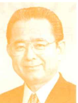
衆議院議員 (自民党) 田中和徳氏