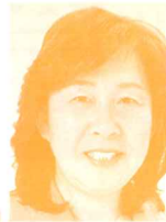
県議会議員 (日本共産党) 加藤なを子氏