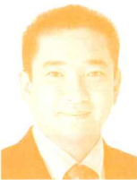
衆議院議員 (希望の党) 本村賢太郎氏